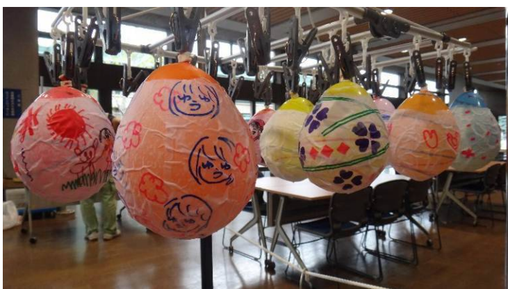
▲ランタン乾燥中。作った人の個性が溢れていて、見ているだけで楽しくなります。