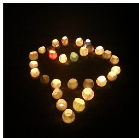
▲試験点灯時のもの。実はきのたんの鼻と口の部分です。完成が楽しみ!