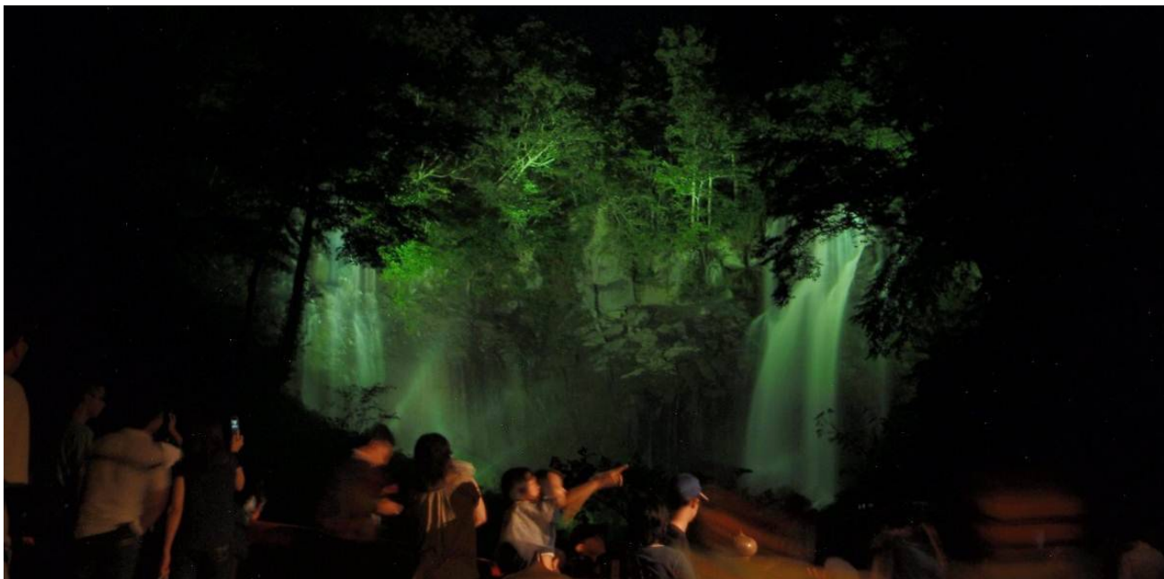
(平成 22 年 8 月 8 日撮影)

滝野公園では 8 月 5 日(金) から 8 月 7 日(日) まで「アシリベツの滝ライトアップ&滝野の夜祭り」を開催しますのでご案内いたします。